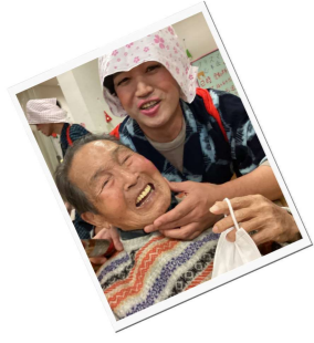
理事長だって変身しますヨ

新年に向けてしめ縄を作りました。職員はなかなか思うように作れませんでした。ご利用者様はさすがの手さばきで完成されました。思い思いのしめ縄を飾り新年を迎えられました。