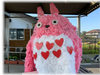
巨大トトロは2メートル駐車場の屋根に届いていました