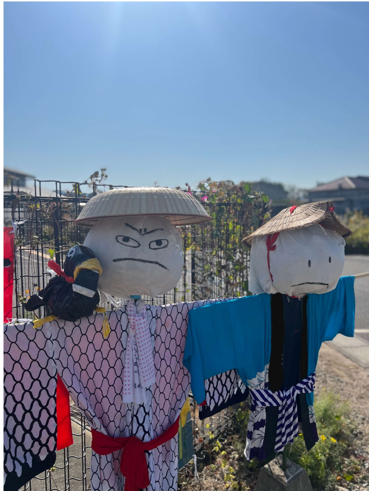
小学生と中学生を見守るかかし隊