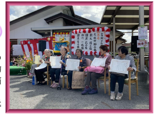
米寿を迎えられた方々