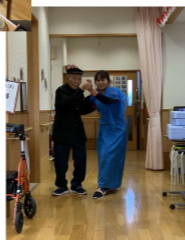
学生気分ですいつまでも若々しく