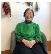
ぬくもりの歌姫たちは衣装を着て