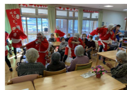
川立ひよっこ同行会の皆さん。 銭太鼓や手品、ダンス・・・、盛りだくさんに楽しませていただきました(^)/

敬老のお祝いをさせて頂きました。今年川地ひよっこ同好会のみなさんも余興を下さり盛り上げて下さいました。グループホームでは職員が手品や踊りを披露し賑やかに祝いさせて頂きました。事業所では毎年の行事ですが、高齢のご利用者さまが来年も参加されるとは限りません。お元気にこの日を迎えられたお祝い、そして長い人生をかけて豊かな時代を築いてくださったことに感謝の気持ちを込めて行事を行いました。これからもお元気に過ごしてお過ごしくださいね。