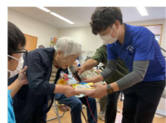
グループホームでは管理者よりお一人づつ記念品をお渡ししました