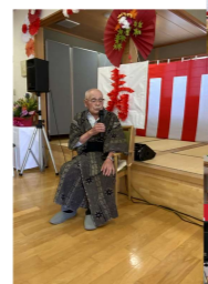
90代力強い歌声でした