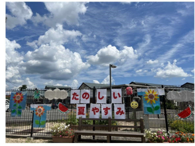
7月～8月 『たのしい夏休み』

5月の運動会に続き川地小学校の生徒さんにぬくもりのフェンスから定期的にメッセージを贈っています。コロナが蔓延し約2年半とても近くの場所でありながら交流を図る事ができなくなっていますが、高齢者の方は子供たち大好きです。メッセージ作成がやりがいになっておられます。子供たちがこのフェンスのメッセージを楽しみにしてくれてると嬉しいです。