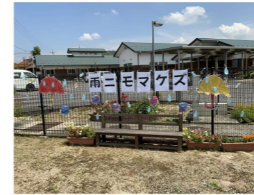
6月～7月 『雨ニモマケズ』